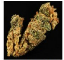
▲ Alerte: cannabi... 5F-MDMB-PICA 06.10.2020