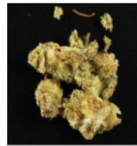
▲ Alerte: Cannabi... 5CI-ADB-A 10.07.2020

Das aktuell auf dem illegalen Markt in der Schweiz verkaufte Cannabis enthält regelmässig synthetische Cannabinoide, die zu einer tödlichen Überdosis führen können. Es ist unmöglich, dieses Gras mit blossem Auge oder aufgrund des Geruches oder des Geschmacks von Cannabis mit einem hohen THC-Gehalt zu unterscheiden.