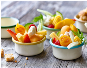
Ersatz- und Übergangsrituale